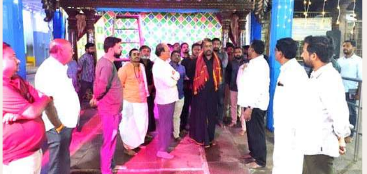
ప్రజలు, ప్రింట్ మీడియా ఎలక్ట్రిక్ మీడియా ప్రతినిధులు పాల్గొన్నారు.