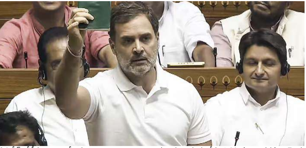
ప్రివిలెజ్ నోటీసు దాఖలు చేశారు.

అదానీ వ్యవహారంపై దడ్రెంపిల్ లోక్ సభ లోక్ సభను స్పీకర్ ఓం బిర్లా ప్రారంభిస్తూ ప్రశ్నిత్రాలు నిర్వహించేందుకు ప్రయత్నించారు. ప్రతిపక్షాలు అదానీ వ్యవహారంపై ఆందోళన చేపట్టాయి. దీంతో సభ సమావేశమైన కొద్ది నిమిషాలకే మధ్యాహ్నం 12 గంటలకు వాయిదా పడింది. లోక్ సభలో ప్రతిపక్ష ఎంపీలు 'మోడీ అదానీ భారు భారు' అని రాసిన నల్ల మాస్కులు ధరించారు. తిరిగి ప్రారంభమైన సభలో కూడా అదే పరిస్థితి నెలకొనడంతో సభను సోమవారానికి వాయిదా వేశారు. ప్రతిపక్ష నేత రాహుల్ గాంధీపై 'ద్రోహి' అంటూ దూషించినందుకు బీజేపీ ఎంపీ సంబీత్ పాత్రపై కాంగ్రెస్ ఎంపీ హిబీ ఈడెన్