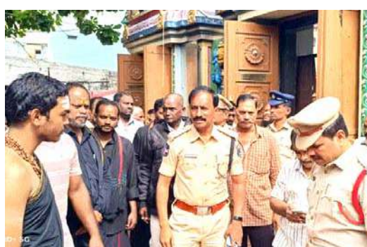
నేరాల నియంత్రణలో సీసీ కెమెరాలు కీలకం