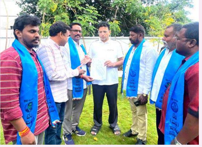
ఉపకులాలకు 5శాతం రిజర్వేషన్లు కోరుతూ మంత్రులను కలిసిన బుడగజంగాలు