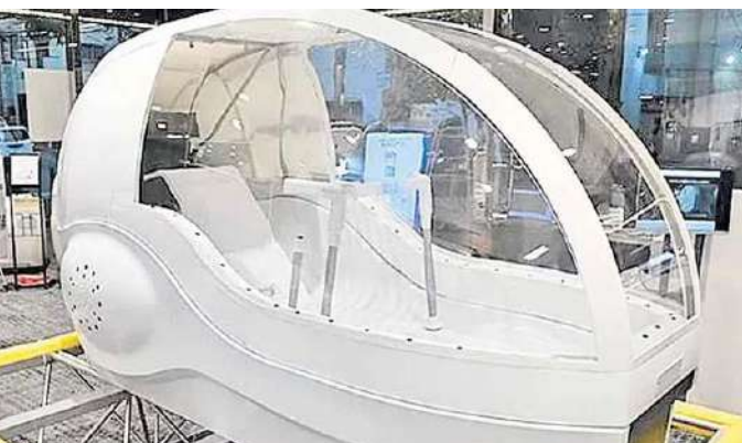
పోల్వే కొత్త వెర్షన్లో అత్యధిక మసాజ్ బాల్స్ వంటివి అమర్చినట్లు తయారీదారులు పేర్కొన్నారు.

బట్టలు ఉతికి ఆరేసినట్లు మనుషులను కూడా ఉతికి ఆరేసే 'హ్యూమన్ వాషింగ్ మెషిన్' భవిష్యత్తులో రాబోతున్నాయి. బాగా అలసిపోయిన వ్యక్తి స్నానం చేసే ఓపిక లేకపోతే.. మెషిన్లోని టబ్లో 15 నిమిషాలు కూర్చుంటే చాలు! కొద్ది నిమిషాల తర్వాత తలతలలాడే శరీరంతో బయటకు రావచ్చు! మెషిన్లోని 'ఏబి' (కృత్రిమ మేధ) వ్యక్తి శరీరం, చర్మం తీరును పరిగణనలోకి తీసుకొని వాష్ అండ్ డ్రై ఆప్షన్స్ నిర్ణయిస్తుంది. జపాన్కు చెందిన 'సైన్స్ కో' కంపెనీ ఇజానీర్లు ఈ మెషిన్ను తయారుచేసినట్లు 'డెయిలీ మెయిల్' కథనం పేర్కొన్నది. ఒకసా కన్నా ఎక్స్పోలో 1,000 మంది అతిథులు ప్రయోగాత్మకంగా వాడుకోవటానికి ఏర్పాట్లు జరిగాయి. ఈ ప్రదర్శన తర్వాత మాస్ ప్రోడక్షన్ వర్కస్ను విడుదల చేస్తామని 'సైన్స్ కో' కంపెనీ చైర్మన్ ఆయోమా వెల్లడించారు. మనుషుల భవిష్యత్తు అవసరాలను దృష్టిలో పెట్టుకొని జపాన్ ఇంజనీర్లు దీనిని తయారుచేశారు. అయితే.. ఈ మెషిన్ డిజైన్ 50 ఏండ్ల క్రితం నాటిది. 1970లో జపాన్ వరల్డ్ సాన్స్ ఎలక్ట్రిక్ కో (ప్రస్తుతం పానసోనిక్) దీనిని మొదటిసారి తయారుచేసింది. దాంతో