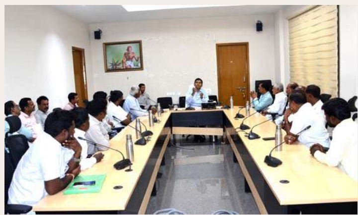
రిజనల్ రింగ్ రోడ్డు వెళ్తున్నందున ఈ ప్రాంత అభివృద్ధి కోసం భూమిని ఇవ్వడానికి ఒప్పుకోవడం శుభపరిణామం.