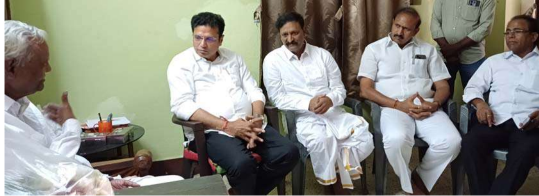
(ప్రజాతీర్పు ప్రతినిధి, కరీంనగర్, నవంబర్ 26)