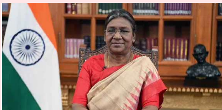
సామాన్యుల జీవితాలు మెరుగవ్వాలి

Circulated From : KARIMNAGAR, HYDERABAD, WARAGAL, RANGAREDDY, MAHABOONNAGAR, THIRUPATI, GUNTUR, KURNOOL, ANATAPUR, VISAKAPATNAM, CHENNAI, BANGALOOOR