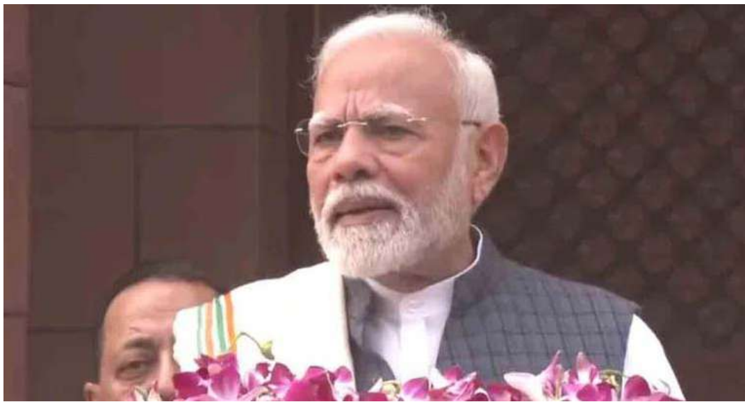
ఎన్నో అంశాలపరంగా ముఖ్యమైనవని ప్రధాని అన్నారు. భారత రాజ్యాంగాన్ని ఆమోదించి నవంబర్ 26 నాటికి 75వ ఏడాదిలోకి అడుగుపెడుతున్నామన్నారు. దానికి గుర్తుగా రేపు

రాజ్యాంగం అమల్లోకి వచ్చి 75 ఏళ్లు అవుతోందని ప్రధాన మంత్రి సరేంద్ర మోదీ గుర్తు చేశారు. పార్లమెంట్ శీతాకాల సమావేశాలు ప్రారంభానికి ముందు పార్లమెంట్ వెలుపల మీడియా పాయింట్ వద్ద ప్రధాని మాట్లాడారు. ఈ సందర్భంగా విపక్ష ఇండియా కూటమిపై తీవ్ర స్థాయిలో విమర్శలు గుప్పించారు. ప్రజలచే తిరస్కరణకు గురైన కొందరు గూండాయిజం ద్వారా పార్లమెంట్ను నియంత్రించేందుకు నిరంతరం ప్రయత్నిస్తున్నారంటూ తీవ్ర స్థాయిలో ద్వేషమెత్తారు. దేశ ప్రజలు వారి చర్యలన్నింటినీ లెక్కిస్తారని.. సరైన సమయంలో శిక్ష విధిస్తారని వ్యాఖ్యానించారు. 'కొందరు స్వార్థ రాజకీయ ప్రయోజనాల కోసం పని చేస్తున్నారు. ప్రజలచే తిరస్కరణకు గురైన కొందరు గూండాయిజం ద్వారా పార్లమెంటుపై నియంత్రణకు ప్రయత్నిస్తున్నారు. సొంత లబ్ధి కోసం పార్లమెంటు సమావేశాలను అడ్డుకునే ప్రయత్నం చేస్తున్నారు. దేశ ప్రజలు వారి చర్యలన్నింటినీ లెక్కిస్తారు. సరైన సమయంలో ప్రజలే శిక్ష విధిస్తారు. పార్లమెంట్లో సానుకూల చర్యలు జరగాలని కోరుకుంటున్నా' అని మోదీ వ్యాఖ్యానించారు. ఈ పార్లమెంట్ సమావేశాలు