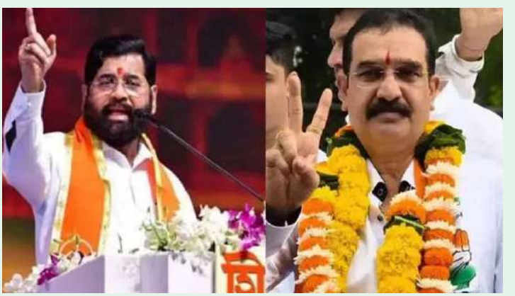
సంవిధాన్ సదన్లో రాజ్యాంగ దినోత్సవాన్ని నిర్వహించినట్లు తెలిపారు. రాజ్యాంగ అమలు ఉత్సవాలు ఐక్యంగా నిర్వహించుకోవాలని పిలుపునిచ్చారు.