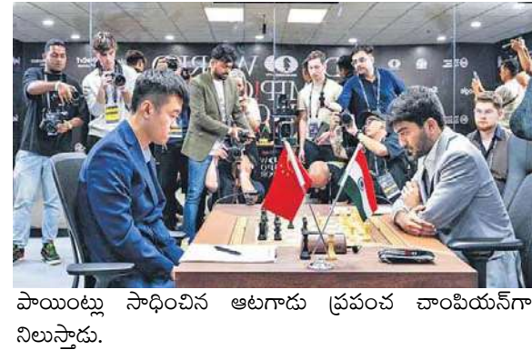
పాయింట్లు సాధించిన ఆటగాడు ప్రపంచ ఛాంపియన్ గా నిలుస్తాడు.

ప్రపంచ చెస్ ఛాంపియన్షిప్ ను యువ గ్రాండ్మాస్టర్ దొమ్మరాజు గుర్రేకే ఓటమితో ఆరంభించాడు. సోమవారం సింగపూర్ వేదికగా మొదలైన ఈ మెగా ఈవెంట్ తొలి గేమ్లో డిఫెండింగ్ ఛాంపియన్ డింగ్ లిరెన్ (చైనా)దే పైచేయి అయింది. గంటా 20 నిమిషాల పాటు సాగిన ఈ షాలో లిరెన్.. 42 ఎత్తుల్లో గుర్రేకేను ఓడించాడు. నల్లపావులతో బరిలోకి దిగిన అతడి ఖాతాలో ఒక పాయింట్ దక్కింది. మొత్తం 14 గేమ్లు ఉండే ఈ టోర్నీలో 7.5