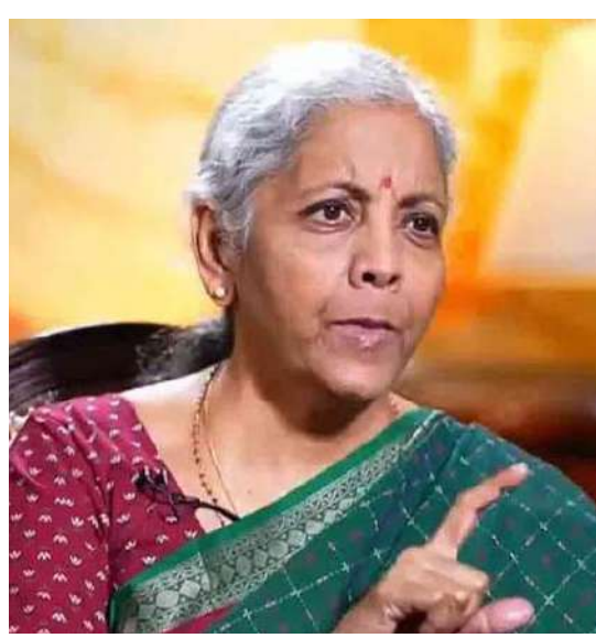
కల్పించలేక పోయామన్నారు. కేంద్ర ప్రభుత్వం ఇన్స్ట్రుమెంట్లకు అనుకూల వాతావరణం క్రియేట్ చేయడానికి ప్రయత్నిస్తున్నదని తెలిపారు.

భారత్లో మహిళల ఎదుగుదలను పితౄస్వామ్య వ్యవస్థ అడ్డుకుంటే ఇందిరాగాంధీ ప్రధానమంత్రి ఎలా అయ్యారని కేంద్ర ఆర్థిక శాఖ మంత్రి నిర్మలా సీతారామన్ అన్నారు. బెంగళూరులో సీఎంఎస్ బిజినెస్ స్కూల్ విద్యార్థులతో జరిగిన చర్చాగోష్టిలో ఆమె మాట్లాడుతూ దేశంలో స్త్రీ, పురుష వివక్ష లేదని, సమానత్వం ఉందన్నారు. మహిళలు తమ కోసం తాము నిలబడటంతోపాటు తర్కబద్ధంగా మాట్లాడితే ఏ పితౄస్వామ్య వ్యవస్థ మహిళల్ని, వారి ఎదుగుదలను అడ్డుకోలేదన్నారు. అయితే, మహిళలకు తగిన సౌకర్యాలు కల్పించేందుకు చర్యలు తీసుకోవాల్సి ఉందన్నారు. 21-24 ఏండ్ల మధ్య వయస్సుల గల నిరుద్యోగ యువతకు కోటి ఇంటర్నల్ షిప్ లతోపాటు వారికి ఉపాధి కల్పనకు కేంద్రం పలు చర్యలు తీసుకుంటున్నదని నిర్మలా సీతారామన్ పేర్కొన్నారు. కేంద్ర ప్రభుత్వం ఎంఎస్ఎంఈలకు మద్దతుగా పని చేస్తున్నదని తెలిపారు. ఈ రంగం నుంచే 40 శాతం కేంద్ర ప్రభుత్వ ప్రొక్యూర్ మెంట్ ఉందన్నారు. దేశంలో రెండు లక్షలకు పైగా స్టార్టప్ కంపెనీలు ఉంటే, వాటిలో 130కి పైగా యూనికార్న్లు అవతరించాయని, కానీ పూర్తి స్థాయిలో అవకాశాలు