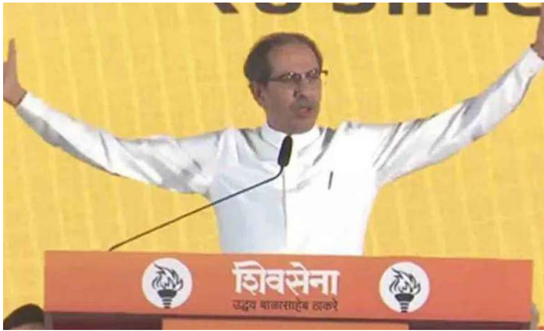
అడ్డీ బహిస్ స్కీమ్' మీద విమర్శలు చేశారు. గతంలో అధికారంలోకి వస్తే ఆ మొత్తం బక్క చిక్కిపోయి 15 పైసలవూతాయన్నారు. బీజేపీ హామీలన్నీ ఇలాగే ఉంటాయని ఎద్దేవా చేశారు.

తాము బీజేపీతో 30 ఏండ్లు మిత్రపక్షంగా కలిసి ఉన్నా గుర్తింపు కోల్పోని శివసేన, ఇప్పుడు కాంగ్రెస్ పార్టీలా ఎలా మారిపోతుందని మహారాష్ట్ర మాజీ సీఎం ఉద్ధవ్ రాట్ నిలదీశారు. కాంగ్రెస్ పార్టీకి మరో వర్షన్ శివసేన అంటూ తమ పార్టీ బీజేపీ చేసిన విమర్శలపై ఆయన ఘాటుగానే స్పందించారు. ఈ నెల 20న జరిగే అసెంబ్లీ ఎన్నికల ప్రచారంలో భాగంగా జరిగిన సభల్లో ఉద్ధవ్ రాట్ మాట్లాడారు. 'మహారాష్ట్రలో ఎన్నికల ప్రచారానికి వస్తున్న ప్రధాని మోదీ, హోంమంత్రి అమిత్ షా మేం బాలా సాహెబ్ బాల్ రాట్ సిద్ధాంతాలను మర్చిపోయాం అంటున్నారు. కానీ నేనేమీమీమీ సిద్ధాంతాన్ని వీడలేదు. కేవలం బీజేపీనే వదిలేశా. బీజేపీతో అసలు బాలా సాహెబ్ బాల్ రాట్ సిద్ధాంతాల్లేవు. 25-30 ఏండ్లుగా బీజేపీతో కలిసున్నప్పుడు బీజేపీ కాలేదు. ఇప్పుడు కాంగ్రెస్ పార్టీతో కలిసి ఉన్నంత మాత్రాన కాంగ్రెస్ లా ఎలా మారిపోతాం' అని ఉద్ధవ్ రాట్ నిలదీశారు. భారీ పరిశ్రమలన్నీ మహారాష్ట్ర నుంచి గుజరాత్ రాష్ట్రానికి తరలిపోతున్నాయని ఉద్ధవ్ రాట్ ఆరోపణలు గుప్పించారు. ఏకీ నాథ్ షిండే సర్కార్ అమలుచేస్తున్న