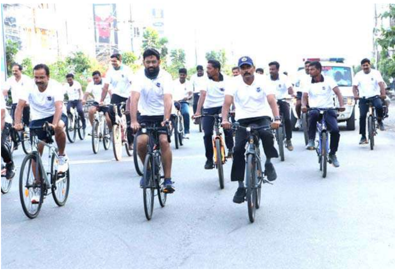
భద్రాద్రి కొత్తగూడెం జిల్లా ప్రజా తీర్పు ప్రతినిధి, సందిష్ అక్టోబర్ 26